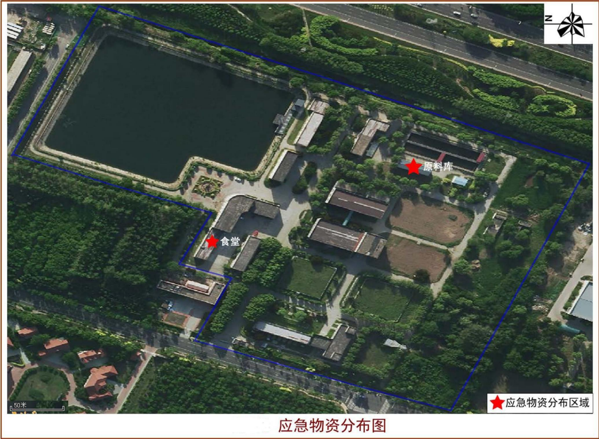
附图 1 环境应急资源单位内部分布图