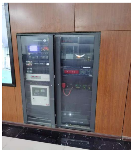
消防报警控制主机