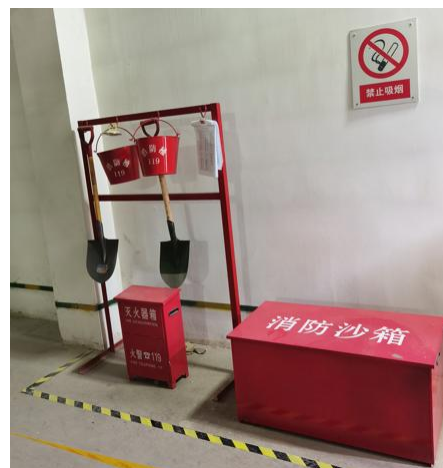
消防沙箱 消防桶 铁锹 灭火器