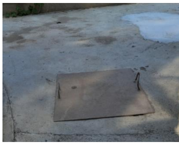
一期污水站地下收集池