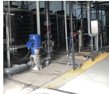
膜处理车间地面收集槽