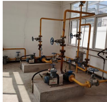
泵房内手动阀、逆止阀