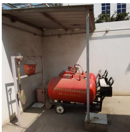
灭火器 消防桶、铁锹