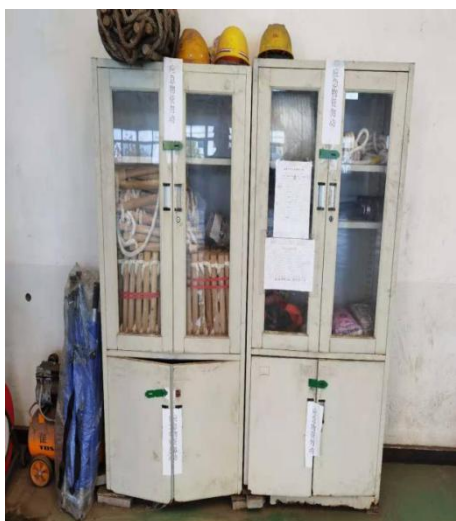
软提 安全绳 担架 安全带 防堵面具