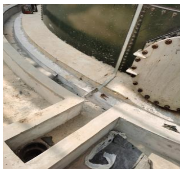
污水处理罐区围堰