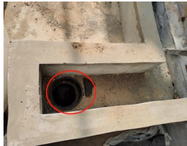
二期污水站地下收集口