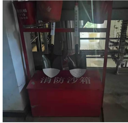
消防沙箱 铁锹 消防桶