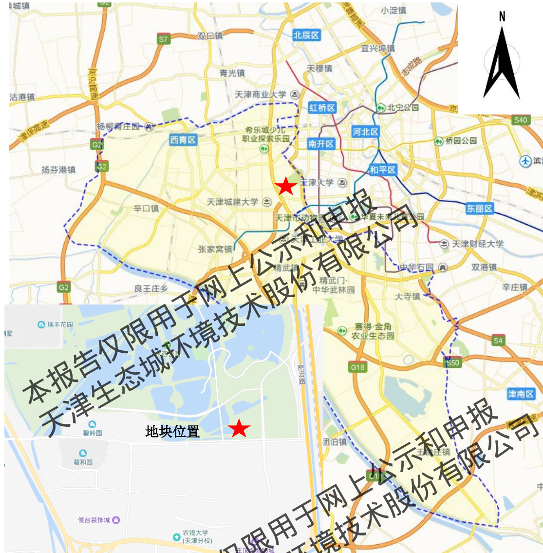
图 2.2-3 地块位置示意图

M 地块位于天津市西青区东北部，外环西路以东，临近水西公园，位置示意图见图 2.2-3。