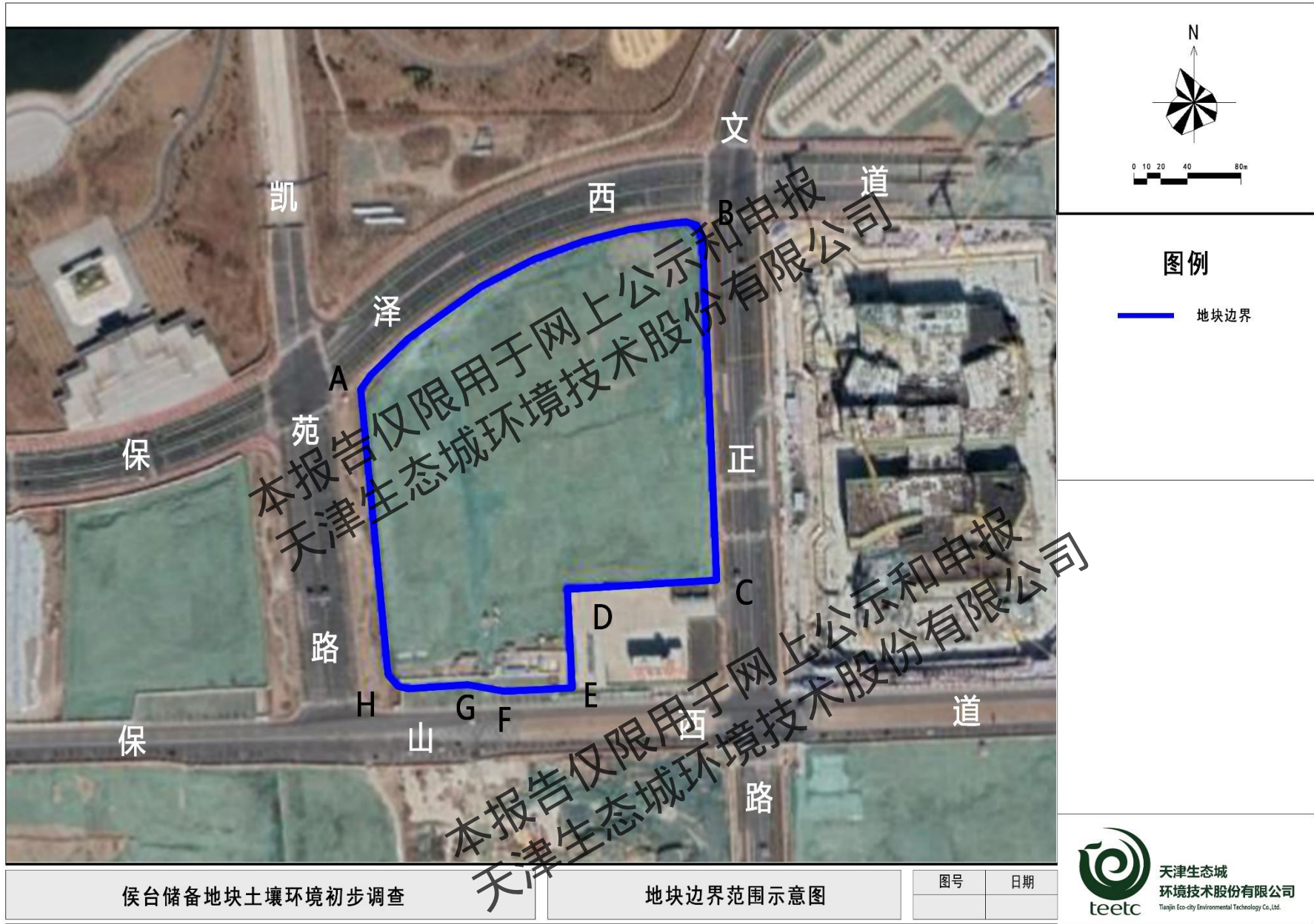
图 1.2-1 地块边界范围示意图