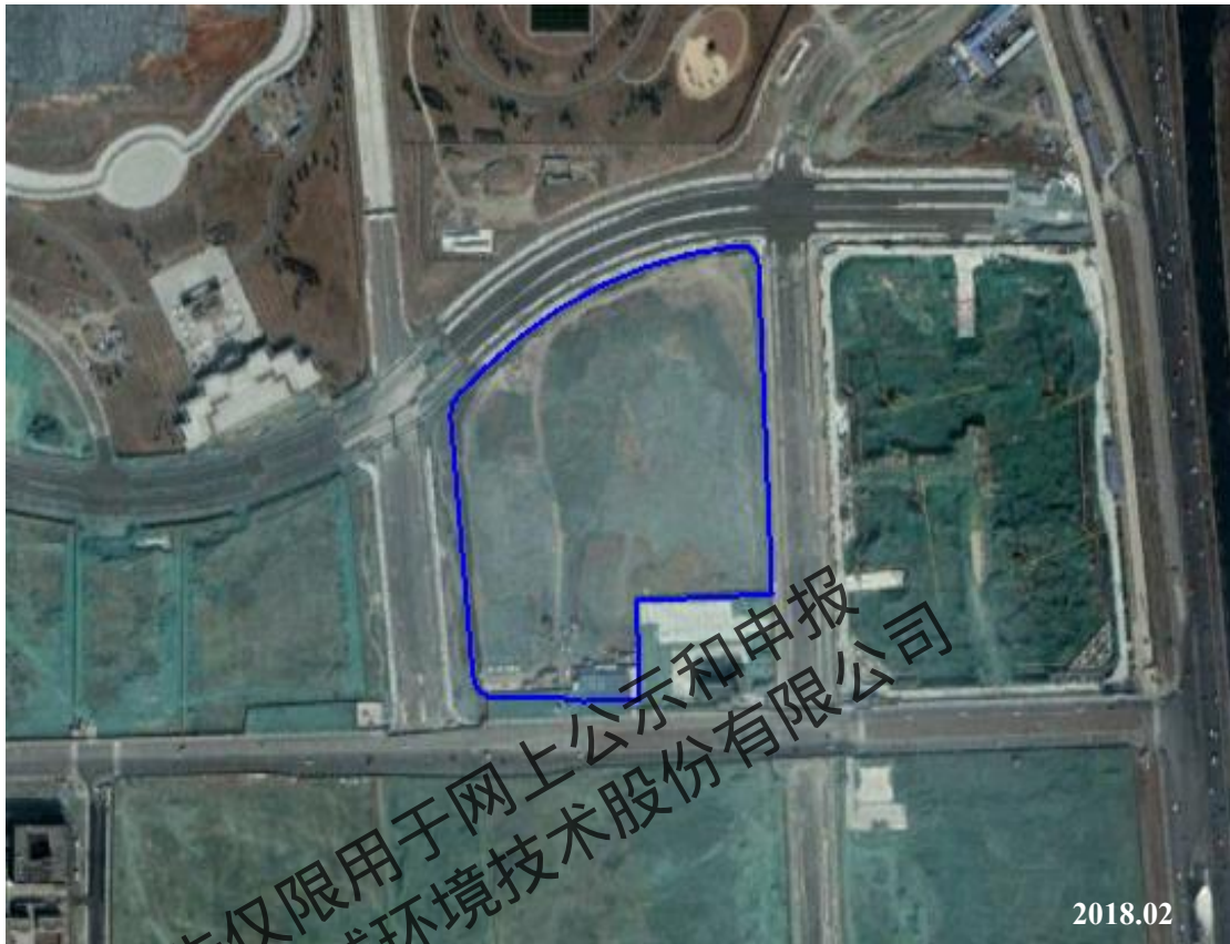
图 2.2-5 地块历史影像图