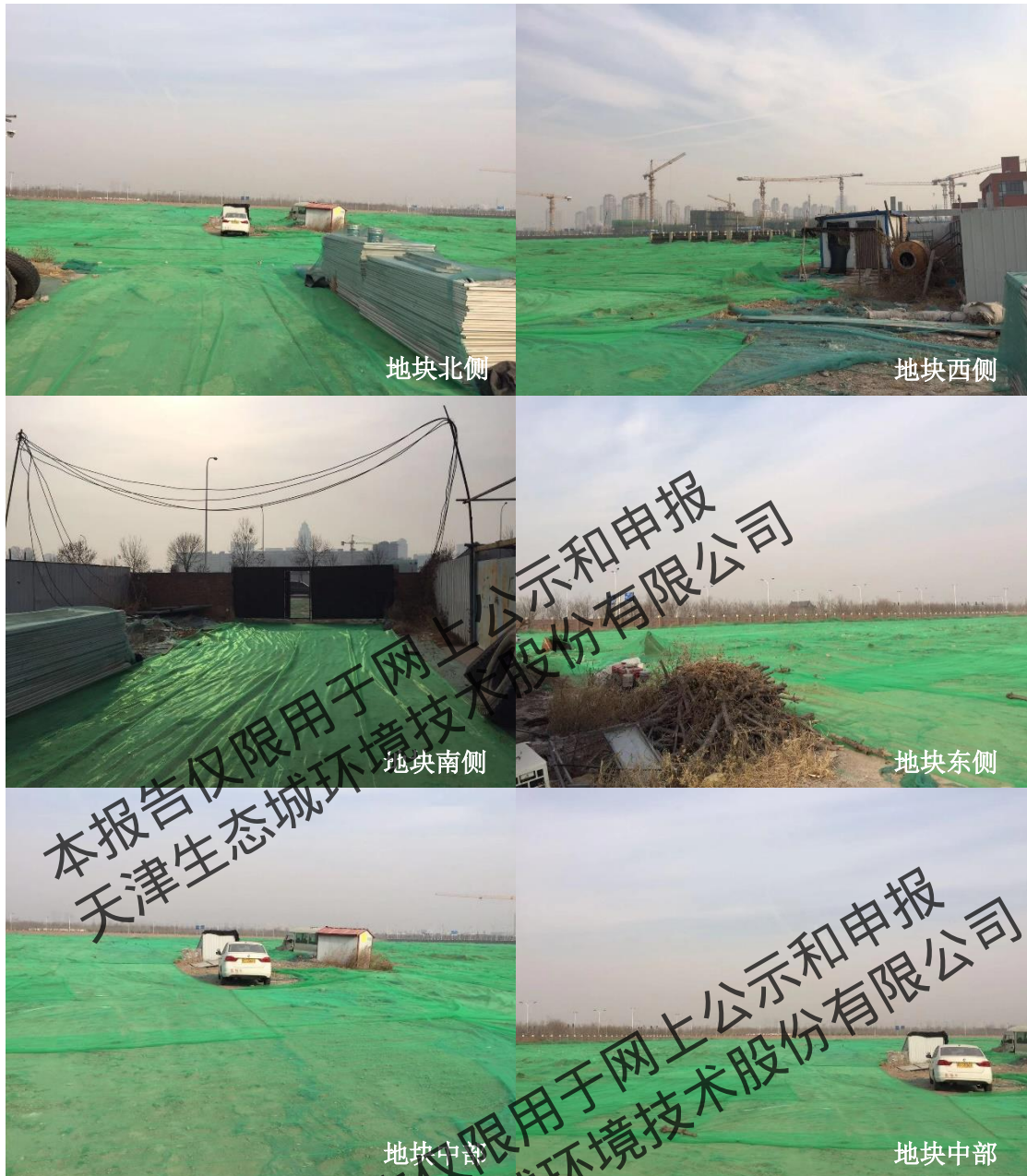
图 2.2.4 地块现状照片（2018 年 10 月）