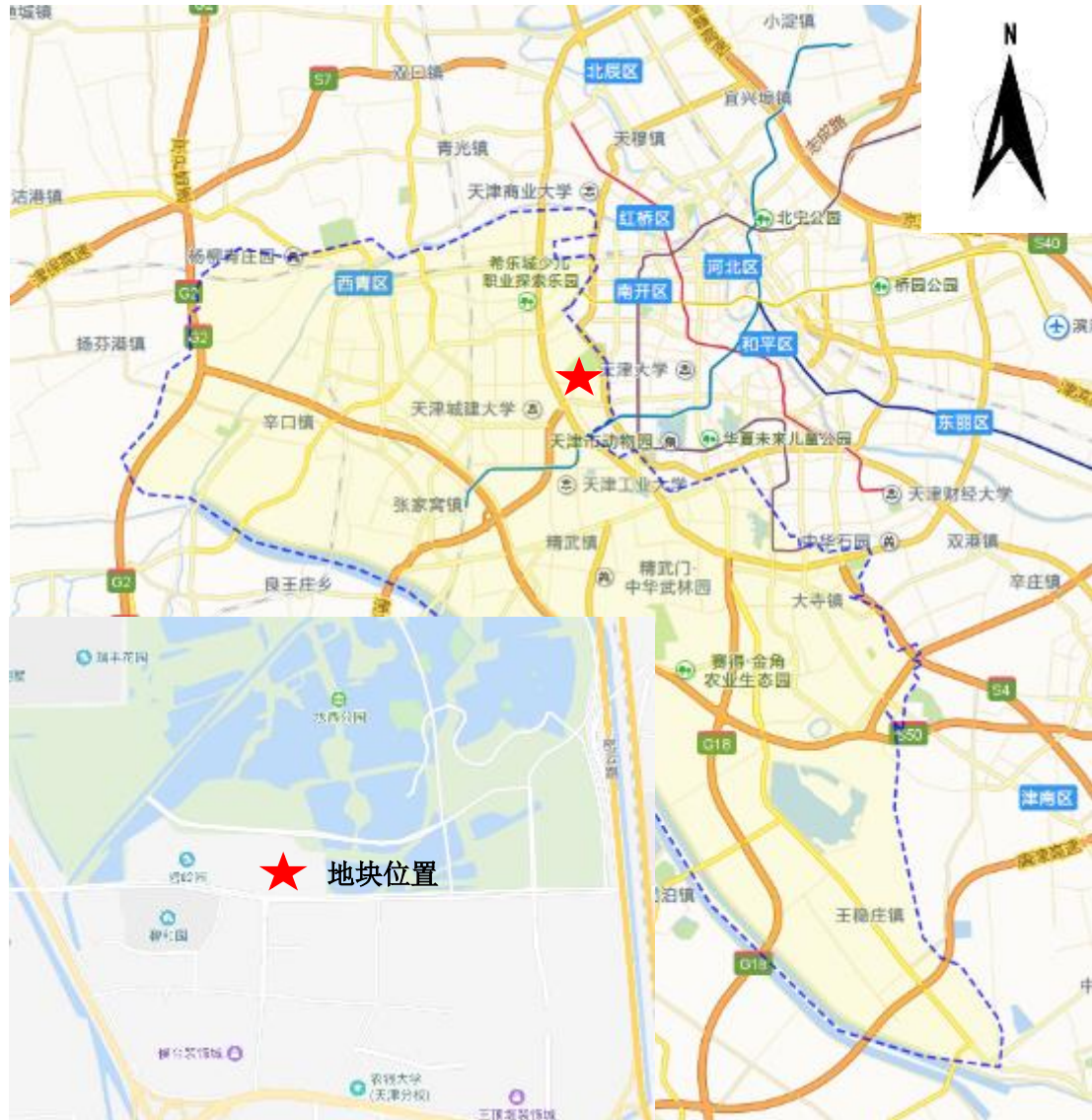
图 2.2-3 地块位置示意图

H 地块位于天津市西青区东北部，外环西路以东，临近水西公园，位置示意图见图 2.2-3。