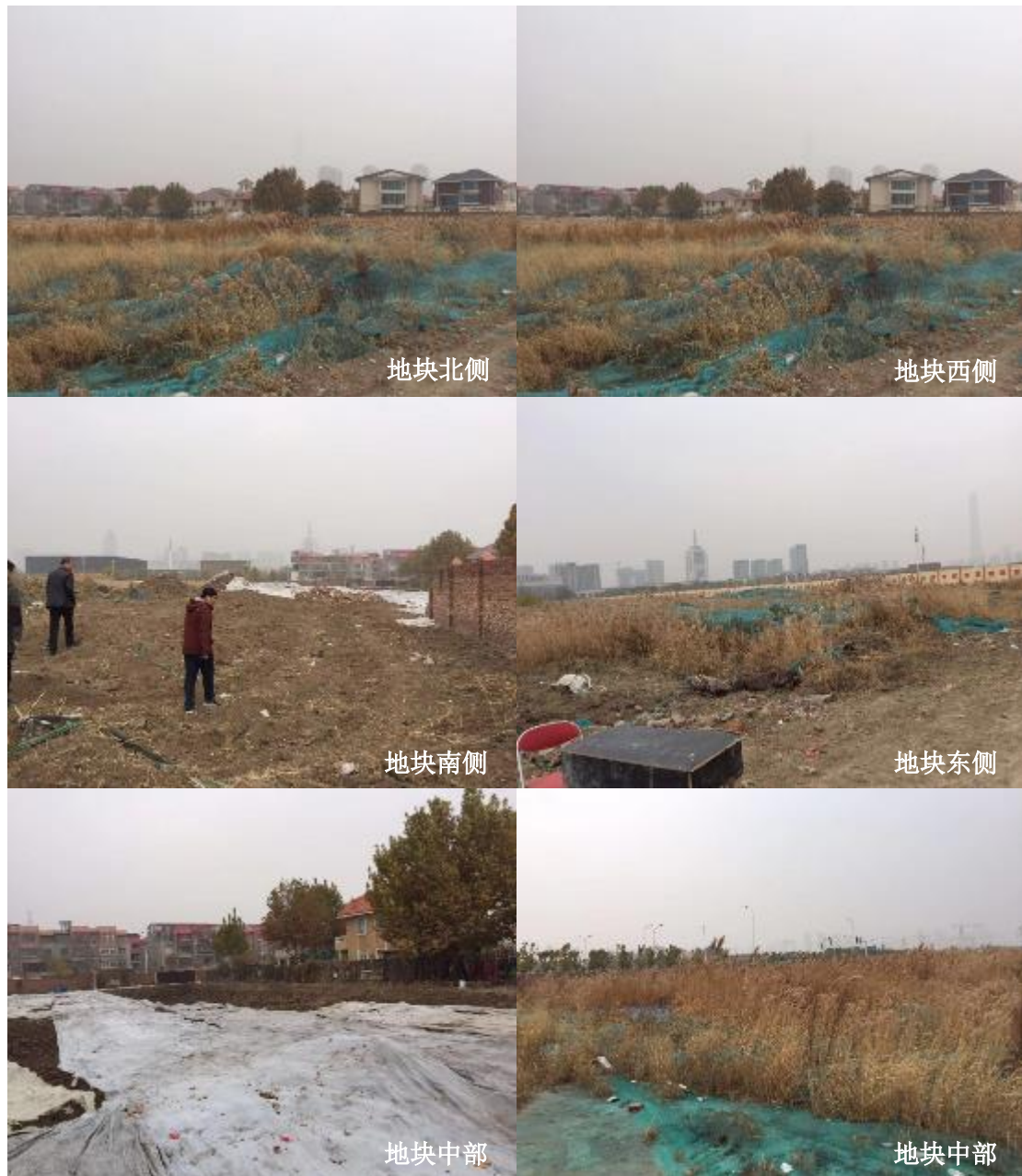
图 2.2-4 地块现状照片（2018 年 11 月）