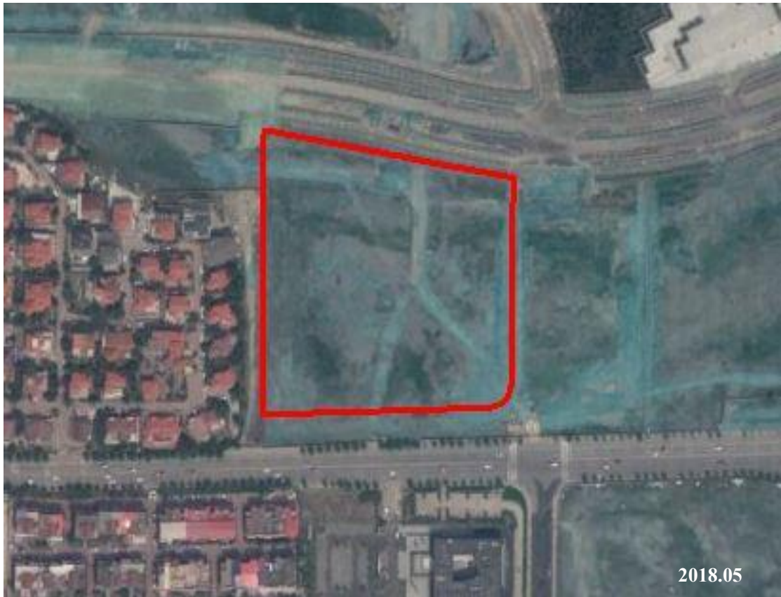
图 2.2-5 地块历史影像图