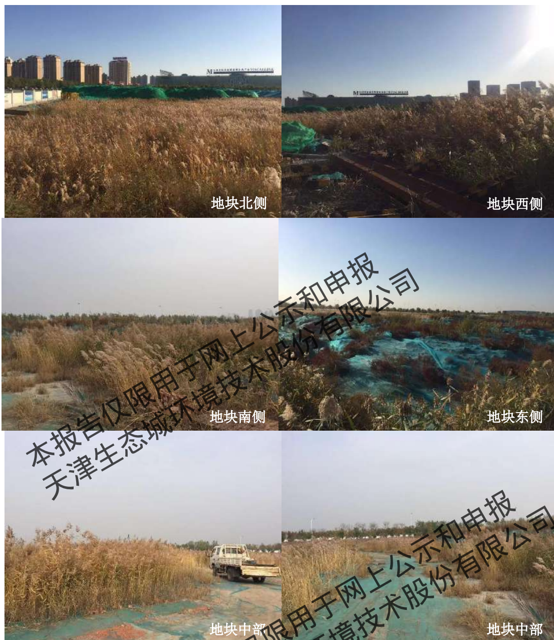
图 2.2-4 地块现状照片 (2018 年 10 月)