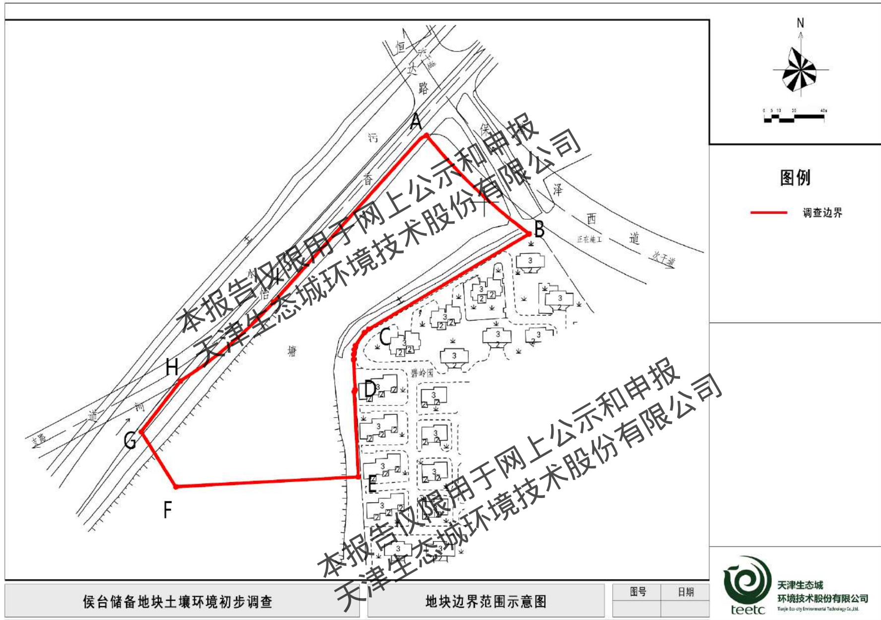
图 1.2-1 地块边界范围示意图