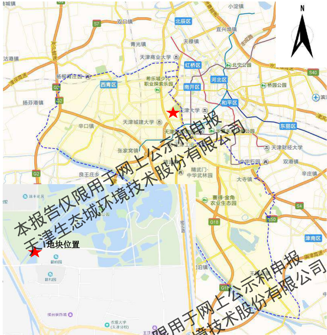
图 2.2-3 地块位置示意图

G 地块位于天津市西青区东北部，外环西路以东，临近水西公园，位置示意图见图 2.2-3。