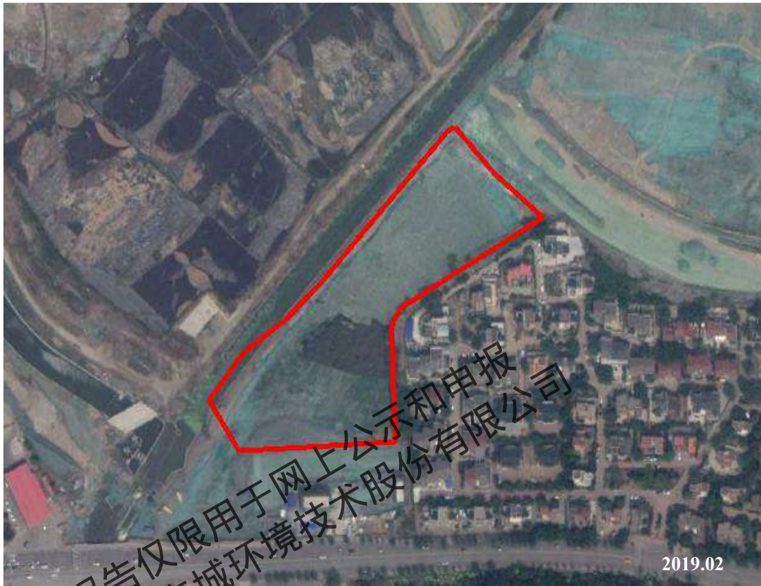
图 2.2-5 地块历史影像图