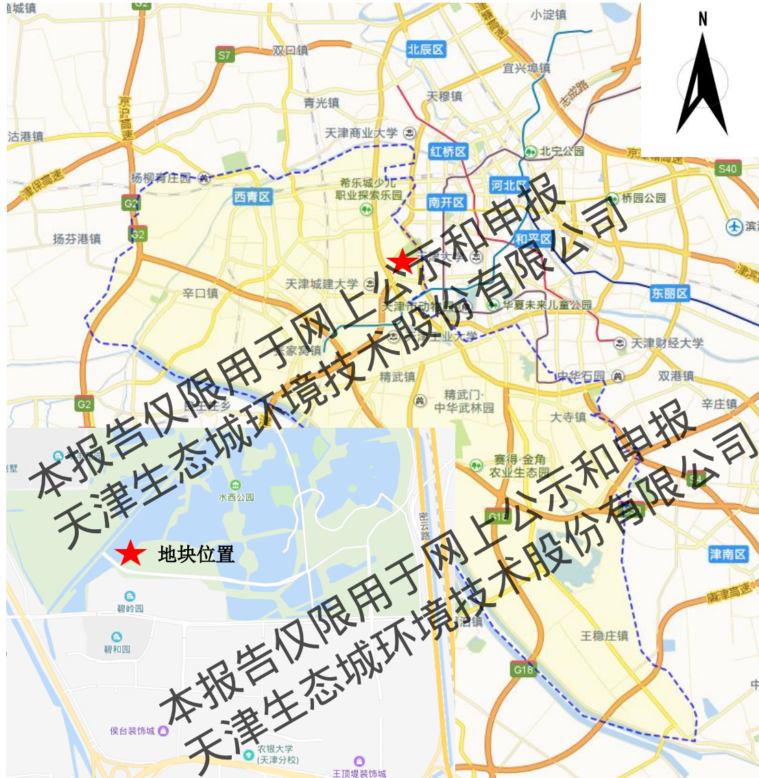
图 2.2-3 地块位置示意图

E 地块位于天津市西青区东北部，外环西路以东，临近水西公园，位置示意图见图 2.2-3。