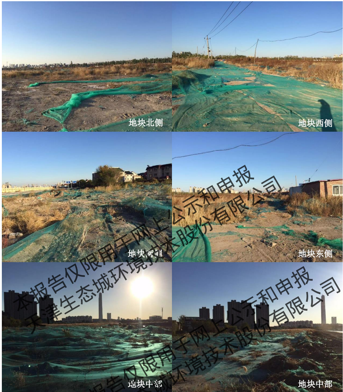
图 2.2.4 地块现状照片（2018 年 10 月）