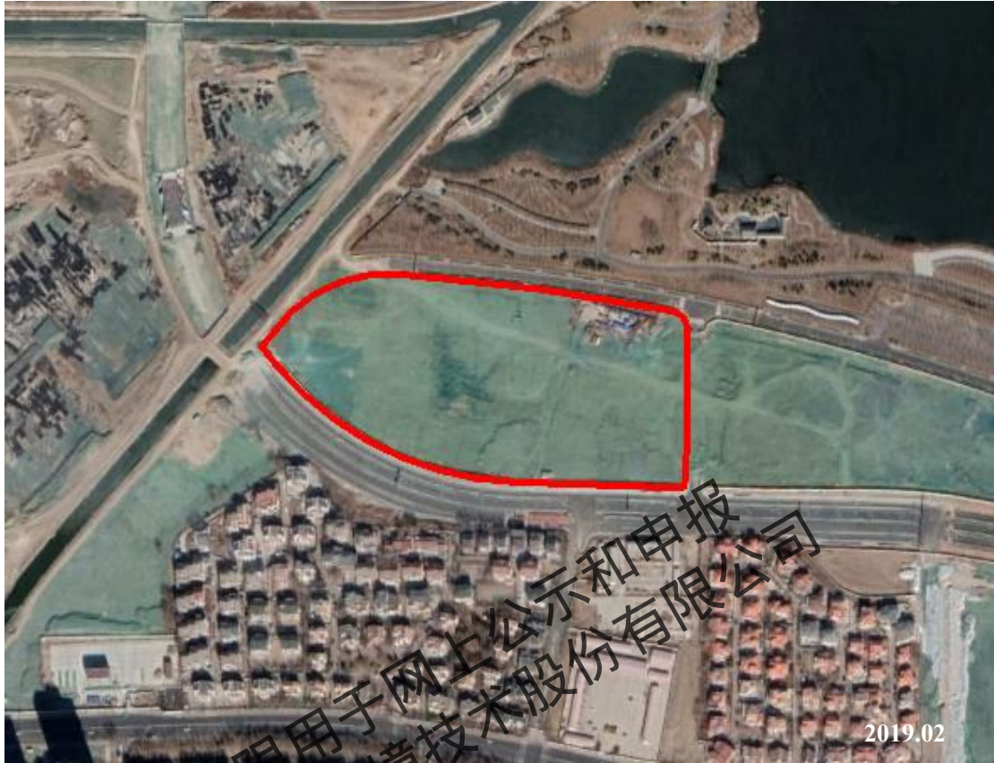
图 2.2-5 地块历史影像图