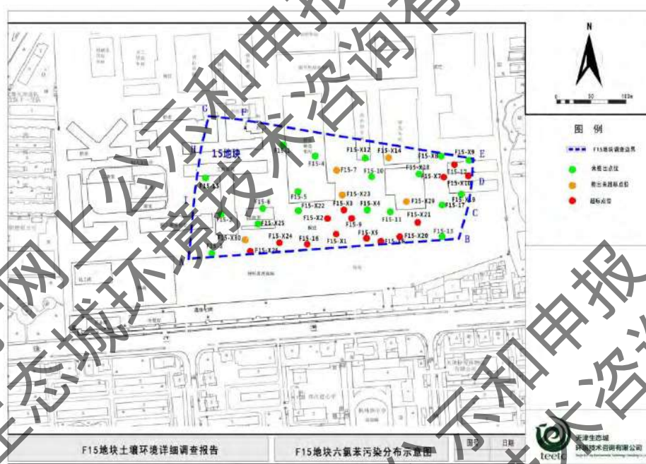
图 4-3 土壤六氯苯分布图

结合初步调查和详细调查结果进行分析：超标样品共计 20 个，超标倍数 0.15-299。超标点位均位于外来填土区域，外来填土与周边临近的区域检出六氯苯但未超出筛选值，或是未检出；纵向上看，外来填土覆盖区域，仅一个点位的原土层表层样品（F15-9-3.5m）检出值超出筛选值，其他原土层未检出，或检出但未超出筛选值。确定 F15 地块外来填土存在六氯苯污染，且超出筛选值，其他区域未检出六氯苯，或是检出但未超出筛选值。