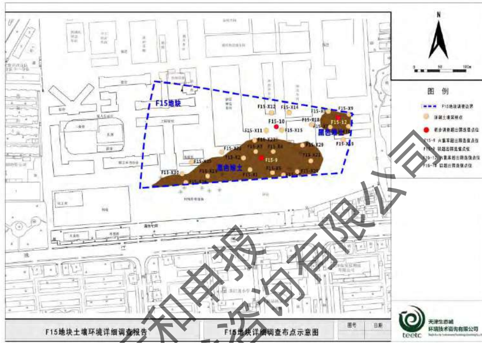
图 4.1-1 详细调查采样点位布置图