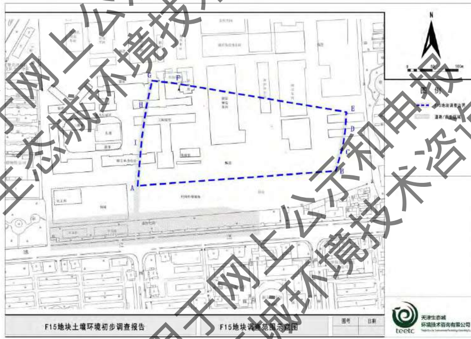
图 1.1-3 场地边界范围示意图