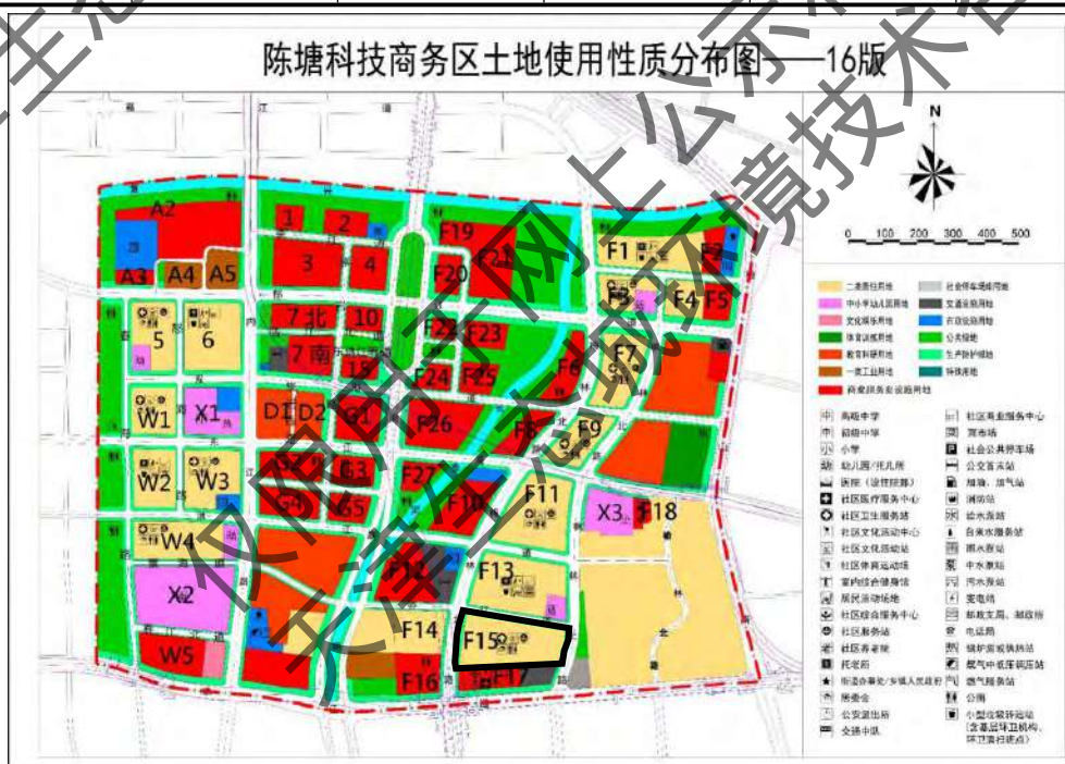
图 1.1-1 陈塘科技商务区土地用地性质分布图-16 版