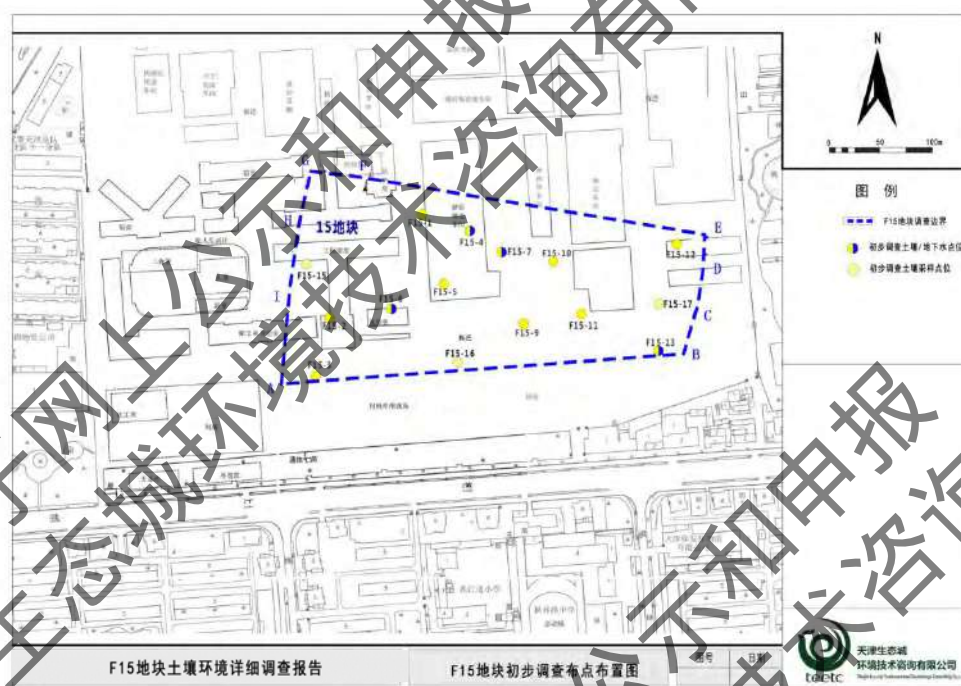
图 2-1 采样点位布置图

本地块面积 51584.7m 2 ，采用系统布点法布设采样点，根据《建设用地土壤环境调查评估技术指南》，初步调查阶段，地块面积>5000m 2 ，土壤采样点位数不少于 6 个，并可根据实际情况酌情增加。布点方案详见下表说明，对于外来填土，检测重金属、VOCs、SVOCs、TPH、有机农药，以便更好的确定是否存在污染，以及确定污染物种类。F15 地块原存在生产车间，布点时需考虑车间布局情况。共计 15 个采样点，其中 F15-8、F15-14 点位由于现场树木限制，该点位没有进行打孔取样。4 个土壤/地下水采样点，11 个土壤采样点。