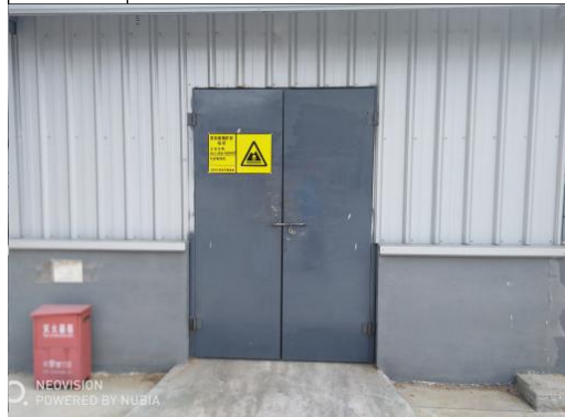
图 4.1.4-1 危废暂存库外部