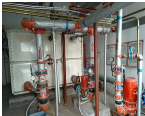
图 4.2-2 消防水泵