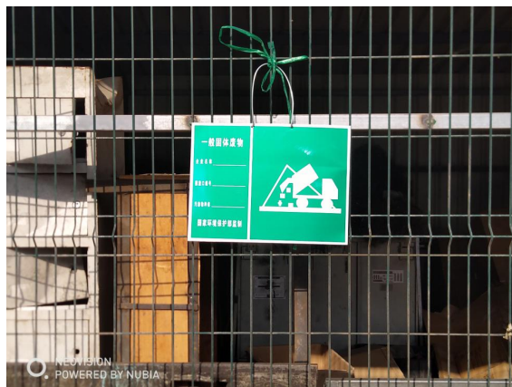
图 4.1.4-3 一般固废暂存场所标识牌