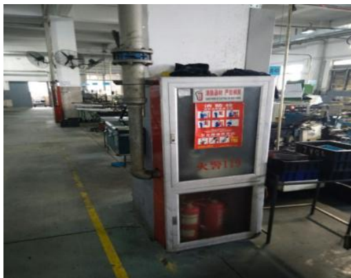
图 4.2-1 消防栓