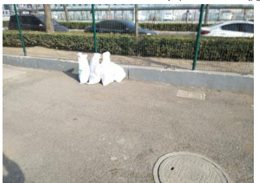
图 4.2-4 用于雨水排口封堵的沙袋