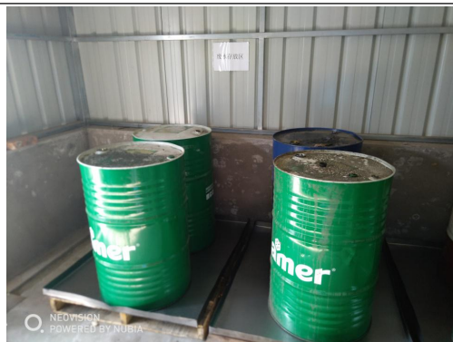
图 4.1.4-2 危废暂存库外部