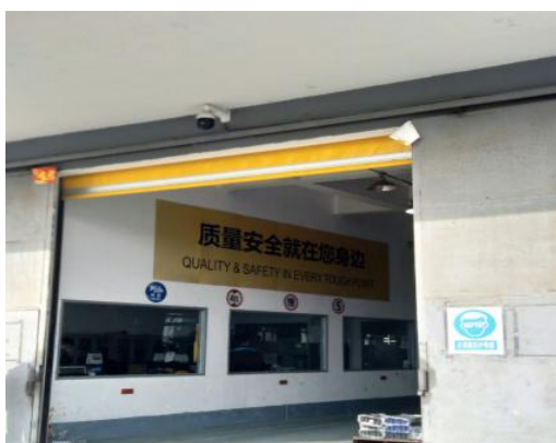
图 4.2-3 视频监控系统