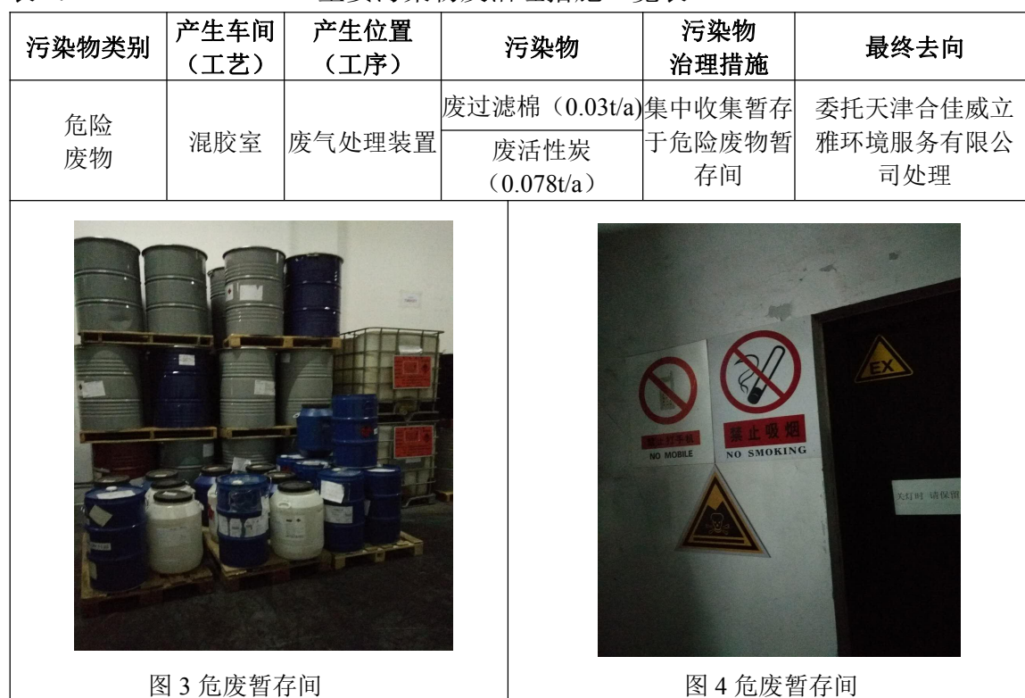
表 4.1-1 主要污染物及治理措施一览表